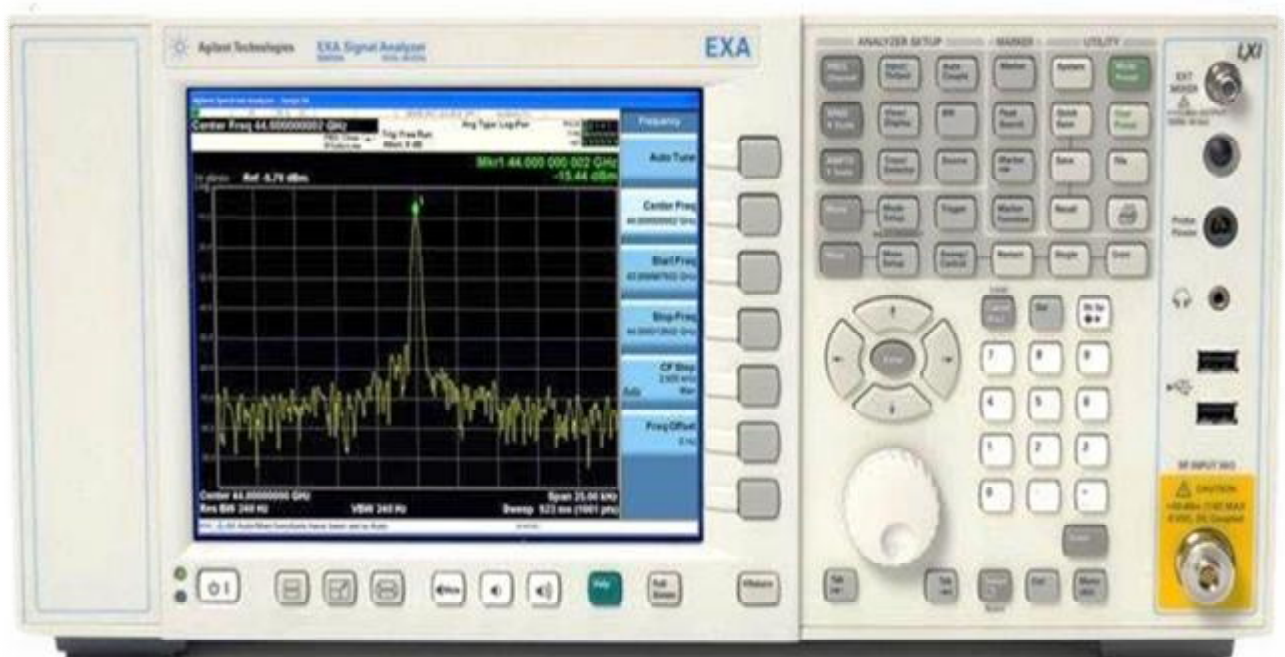
Рисунок 1 - Внешний вид анализатора

Внешний вид анализатора приведен на рисунке 1.